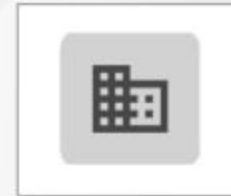
شرکت رخ‌نیزو خراسان