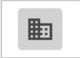
شرکت سالیان ساخت تریب