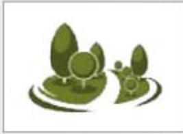
انجمن صنفی پیمانکاران فضای سبز و محیط زیست خراسان رضوی