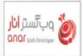
شرکت وب گسترانار